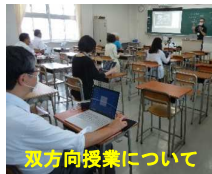
双方向授業について

本校でも、講習会をうけ各教科の先生方が生徒を対象とした双方向授業に取り組んだり、先生方のPC接続テストを兼ねて、職員朝礼を試験的にZOOMで開催するなど、システム管理部、教務部を中心に全教職員で校内ICT環境の整備を進めています。