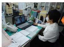
県担当者とのオンラインミーティング