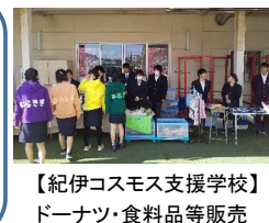
【紀伊コスモス支援学校】 ドーナツ・食料品等販売

産業デザイン科2年 産業デザイン科3年 創造技術科2年 建築科2年乙組 産業デザイン科1年