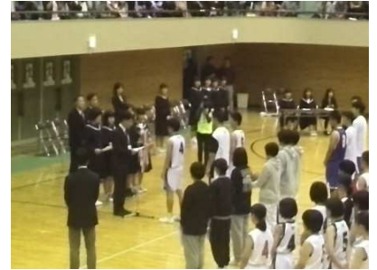
【バスケ部ウインターカップ出場】