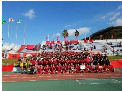
【ラグビー部 4 年連続24 回目の花園】