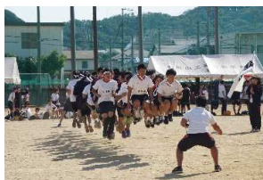
【みんなでジャンプ】