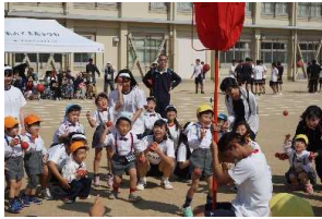
【特別ゲスト！ナザレ幼稚園の園児！生徒と一緒に玉入れ】