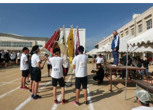
【正々堂々闘うことを誓った選手宣誓】 【科対抗綱引きは機械科甲組が優勝】