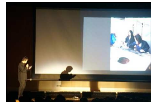
【プレゼンコンテスト】