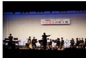
【オープニング演奏】

25日(木)と25日(金)の2日間、「半端ないって！ 迫真！ 平成最後の和工祭」のテーマで和工祭が開催されました。体育館では吹奏楽部によるオープニング演奏で開会し、舞台発表、ものづくりプレゼンコンテスト発表と展示が披露され、校庭では模擬店等が開店されました。2日目は各種展示、模擬店の他、芸能大会や軽音楽同好会による演奏が舞台で繰り広げられた後、閉会式では、それぞれの取組に対しての表彰がありました。生徒会の大活躍により、例年にも増して盛り上がりのある和工祭となりました。