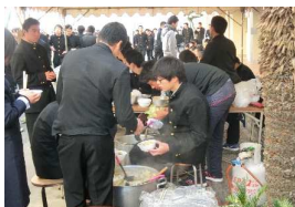
【模擬店最優秀賞 せんべい汁】