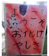
【行列のできたお化け屋敷】