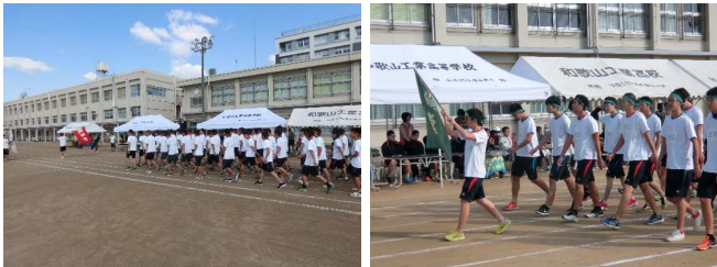
【校舎の改修工事の影響で、3年ぶりとなった入場行進、3年生にとっては最初で最後の入場行進となりました】

当初、10月19日(木)に開催を予定していた体育大会が悪天候のため10月31日(火)の開催となりました。それが功を奏したのか、秋晴れの最高のコンディションの下、盛大に体育大会を開催しました。100M走やリレーといった陸上競技種目から、むかへ競走やみんなでジャンプといったレクリエーション種目まで精一杯の力で競い、見る者にたくさんの感動を与えてくれました。校長先生の講評にもあった生徒全員が活躍した“素晴らしい体育大会”となりました。