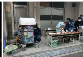
【模擬店自家製ビザ焼き機】