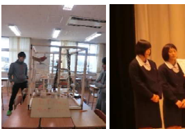
【ビー玉コースター】