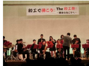
【オープニング演奏】

10月24日(火)と25日(水)に開催を予定していましたが、和工祭も体育大会同様に悪天候により1日順延して25日(水)と26日(木)の2日間、「和工で沸こう!! THE和工祭!!輝きの向こうへ」と題して和工祭が開催されました。体育館では吹奏楽部によるオープニング演奏で開会し、舞台発表、ものづくりプレゼンコンテスト発表と展示が披露され、校庭では模擬店等が開店されました。2日目は各種展示、模擬店の他、芸能大会や軽音楽同好会による演奏が舞台で繰り広げられた後、閉会式では、それぞれの取組に対しての表彰がありました。