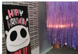
【和工大賞 Trick or Treat♪】