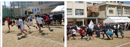
【熱戦のクラブ対抗リレー】