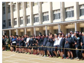
【過熱する応援合戦】