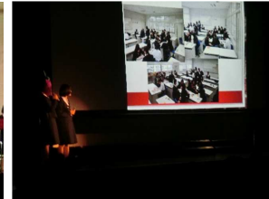
【プレゼンコンテスト】