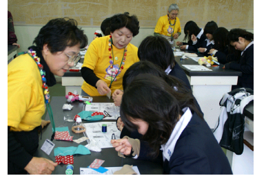
〈ななこの会の皆さんからのお手玉作り指導風景〉